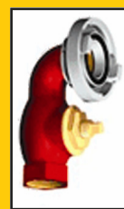
Bocas de Incêndio