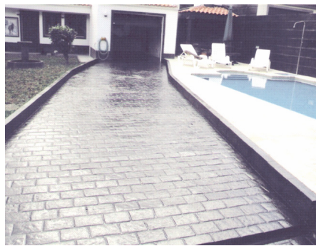
Representante exclusivo para os Açores PISOBETÃO

O PISOBETÃO, é projectado para se usar em qualquer área de superfície atractiva e duradoura, e depois da superfície acabada não requer grande manutenção. É aplicado em parques de estacionamento, passeios, áreas de piqueniques, à volta das piscinas, parques municipais, arruamentos, urbanizações, etc.