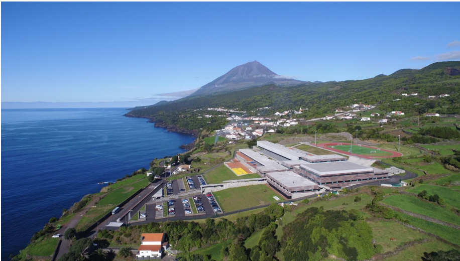
Sede da empresa

Por isso entendemos ser essencial manter o investimento público e os quadros de apoio ao investimento privado, para que se mantenha a atividade da construção. Também chamamos à atenção que, para salvaguardar a economia regional, terá que ser dada atenção aos prazos de pagamentos por parte das entidades públicas.